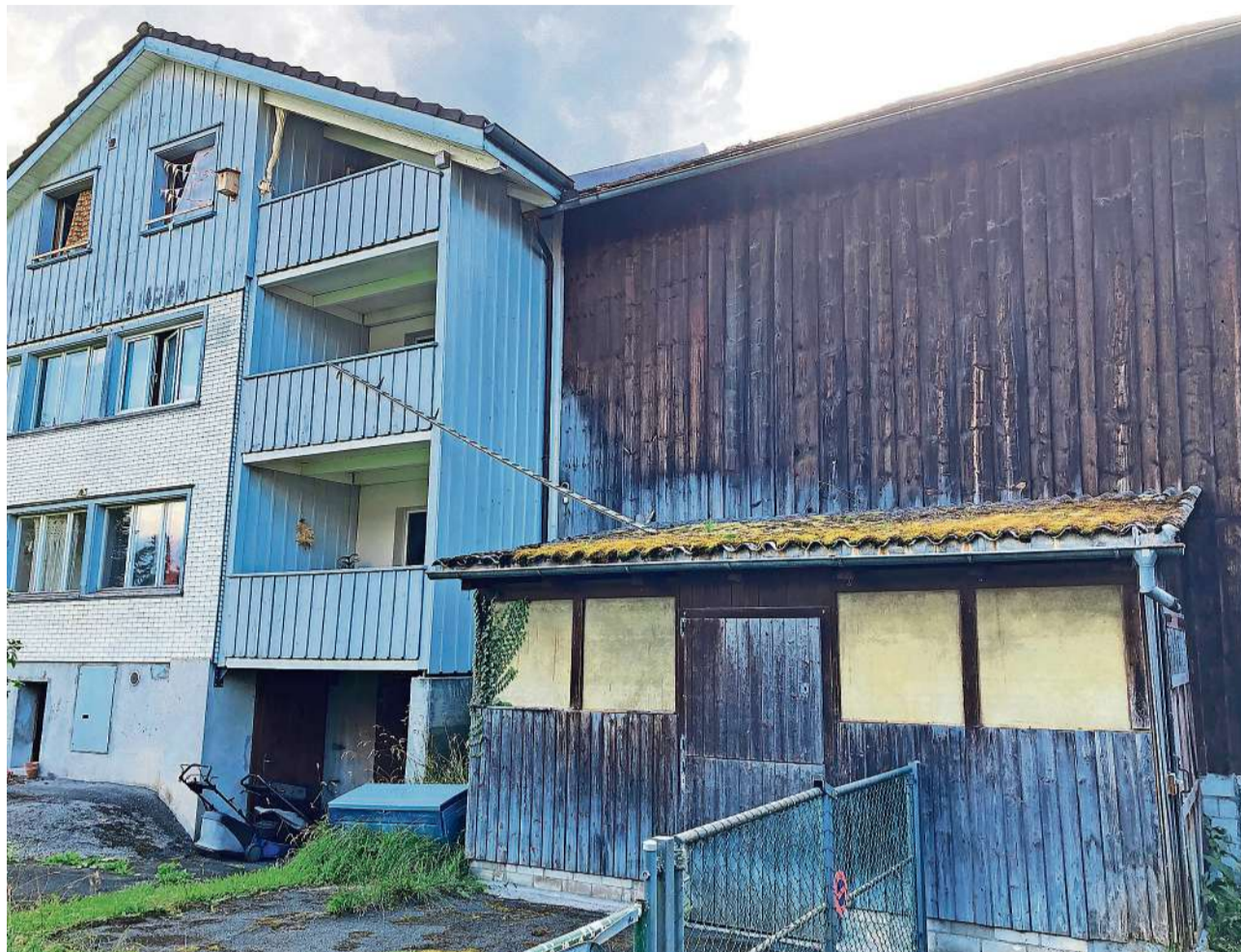
Zwischen Architektur, Tierschutz und Gesetzestreue erzählen Katzentreppen eine einzigartige Geschichte schweizerischer Zivilisation. In Buchs/SG führt beispielsweise eine waghalsige Einrichtung vom Balkon des Hauses aufs Dach eines angebauten Schopfs. So gefährlich diese Konstruktion anmuten mag, eine Katze bewältigt diese mit bewundernswerter Anmut.

«Das Faszinierende an Katzenleitern ist ihre Eigentümlichkeit», heisst es im Vorwort. «Es sind beiläufige Architekturen des Alltags, die sich an Fassaden emporziehen und vom stillen Zusammenleben von Mensch und Tier erzählen.»