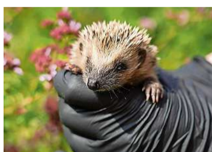
Die Igelpflegestation des Walter Zoos in Gossau blickt auf ein intensives Igeljahr 2025 zurück.

Gossau Auffällig war insbesondere der saisonale Verlauf. Während in den ersten Monaten des Jahres nur wenige Igel eingeliefert wurden, nahm die Zahl der Fundtiere ab April deutlich zu. Ihren Höhepunkt erreichte die Station im Oktober. In dieser Phase werden häufig geschwächte erwachsene Tiere sowie untergewichtige Jungigel aufgefunden. Wie bereits in den vergangenen Jahren waren Verletzungen die Hauptursache für eine Aufnahme. Rund ein Viertel der Tiere litt an Traumata – etwa durch Bissverletzungen, Gartenmaschinen oder den Strassenverkehr. Daneben stellten auch