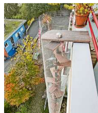
Trotz ihrer 54 Stufen sicher: Diese Leiter in Höngg ist mit einem Drahtgitter umspannt.

Ein professioneller Katzenleiterkonstrukteur aus der Inner- schweiz ist für diese Profileiter verantwortlich. Die Feuerpolizei stellte beim Umbau des Hauses in Zürich-Höngg laut den Buchautoren nämlich fest, dass die Katzentür in der Fassade nicht regelkonform war. Um ihrem freiheitsliebenden Bauernhofkater Noa keine Ausgangssperre aufzuhalten, organisierte die Besitzerin eine 54-stufige Leiter mit Drahtgitter, damit er nicht runterfallen kann. Als Dank bringt Kater Noa ab und zu eine Maus nach Hause.