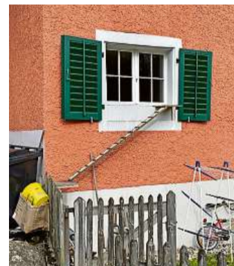
Holzkonstruktion: Diese Katzenleiter in Zumikon ermöglicht direkten Zugang zum Küchenfenster.