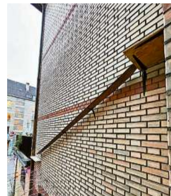
Backsteingebäude am Zürcher Sihlquai: Auch hier findet man eine Katzenleiter.