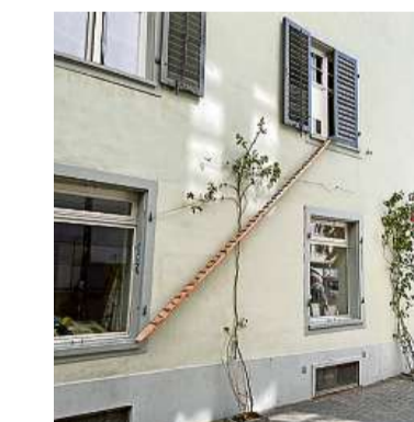
Winterthurer Altstadtgasse: Die Katzenleiter führt zum Fenster mit eingebautem Katzentörchen.

Dieses Modell führt von einer Winterthurer Altstadtgasse in den ersten Stock. Noch ist Kater Lui nicht in Sicht. Vielleicht hat er es sich gerade in einem Schaufenster in der Nachbarschaft gemütlich gemacht oder gönnt sich eine Pause vor der Öffentlichkeit: Auf Instagram folgen ihm über 4000 Menschen. 2025 hat er sogar einen Festivalpass der Winterthurer Musikfest-