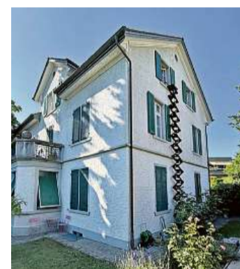
Mehrfamilienhaus in Wetzikon: Eine sieben Meter lange Katzenleiter wurde an der Fassade angebracht.

in Wetzikon musste eine Katzenleiter her. Zum Glück lässt sich das Faltmodell auf sieben Meter ausziehen. Katzendame Mina nutzt diese laut den Autoren aber nur noch zum Hinaufsteigen: Seit sie für einen Tierarztbesuch in einem Picknickkorb herumgetragen wurde, besteht die schöne Mina darauf, dass man sie im Korb in den Garten trägt.